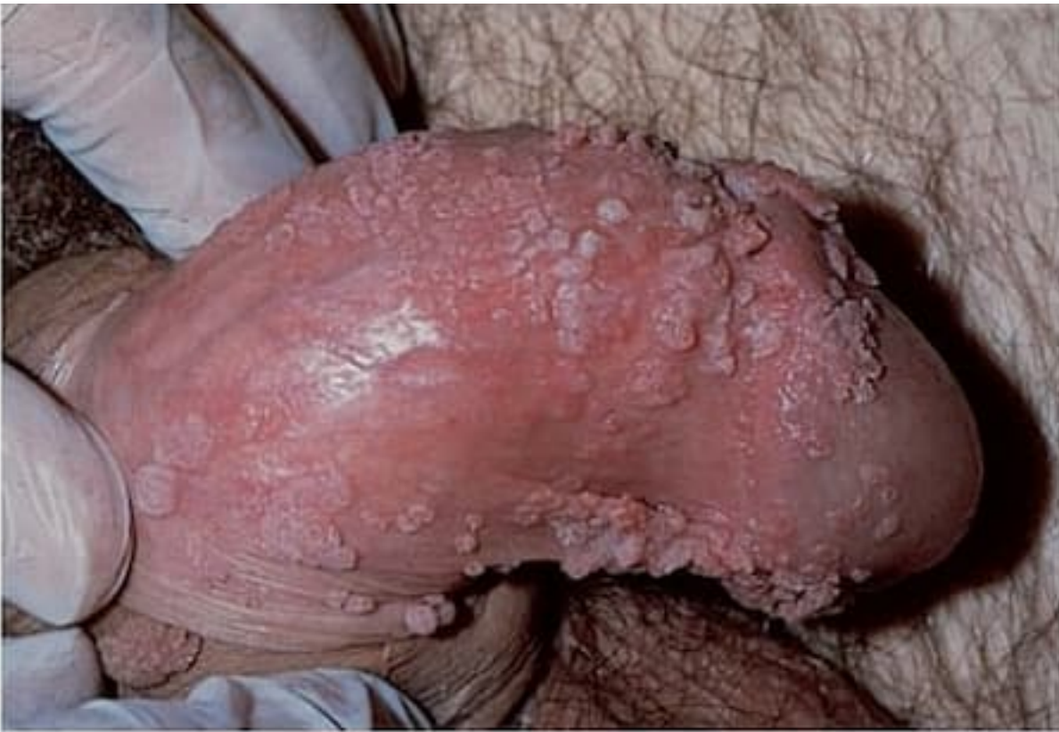
Hình ảnh bộ phận sinh dục nam bị bệnh sùi mào gà