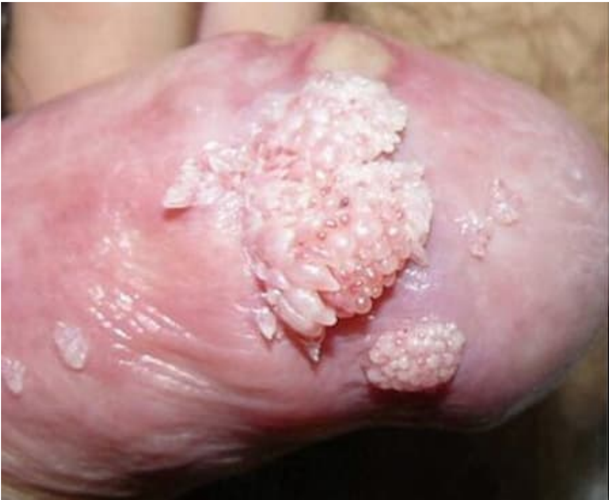
Hình ảnh sùi mào gà ở rãnh lớp da bọc dương vật