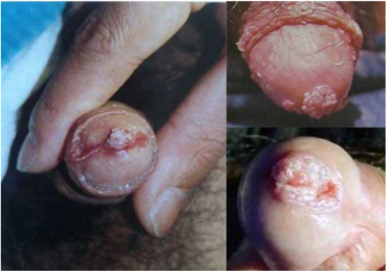
Hình ảnh sùi mào gà tại trong bộ phận sinh dục nam