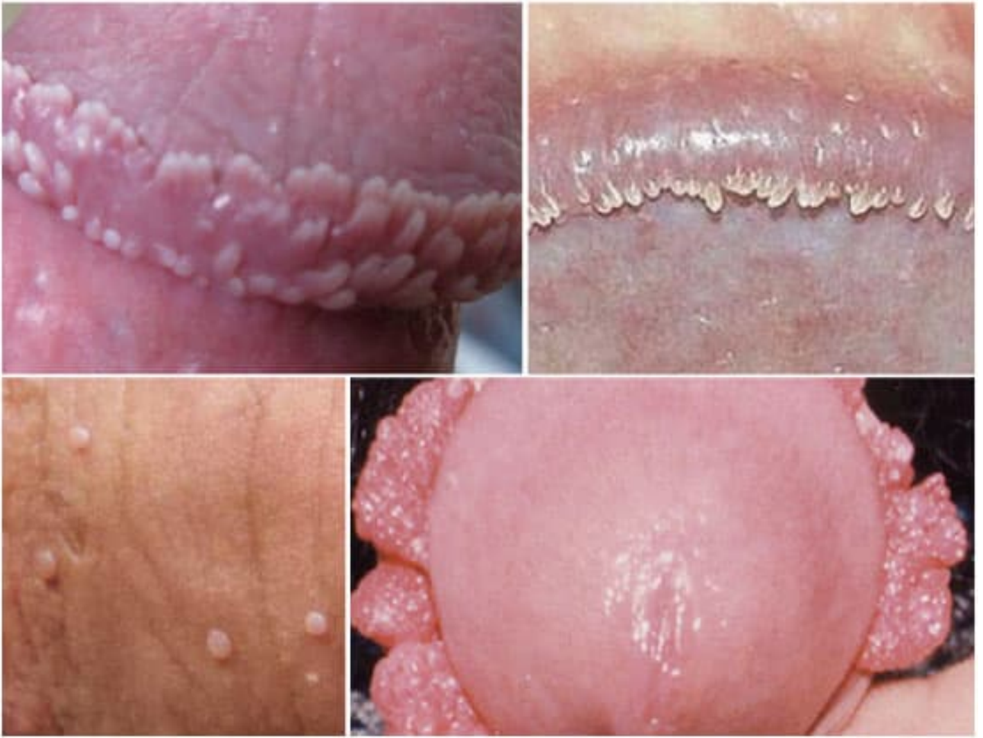
Hình ảnh bệnh lý sùi mào gà tại rãnh lớp da bọc dương vật